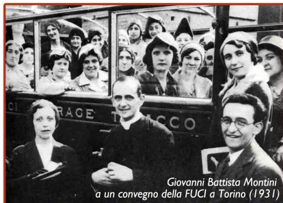
Giovanni Battista Montini a un convegno della FUCI a Torino (1931)